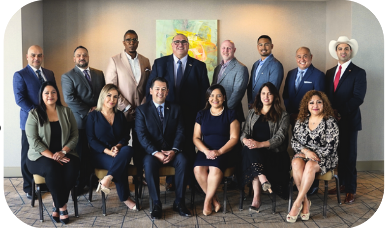
Miembros del Board de RHCA 2022-2024

Los nominados para Director del Board deben ser miembros en regla.